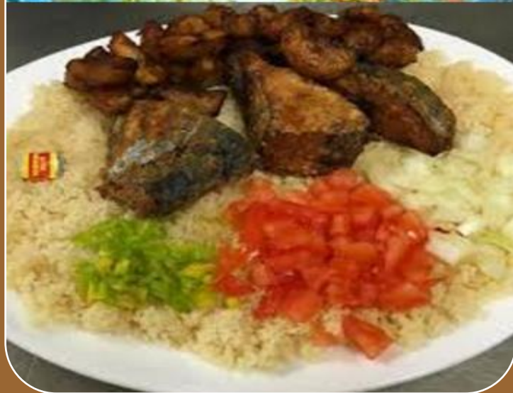
Garba des Autres