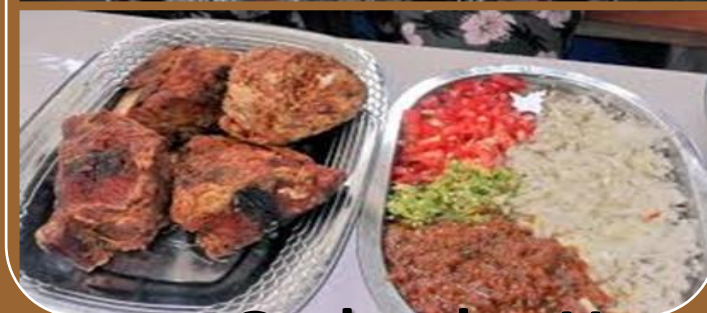
Garba des Uns