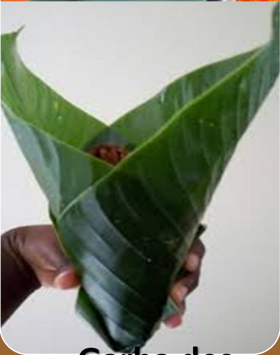
Garba des etc